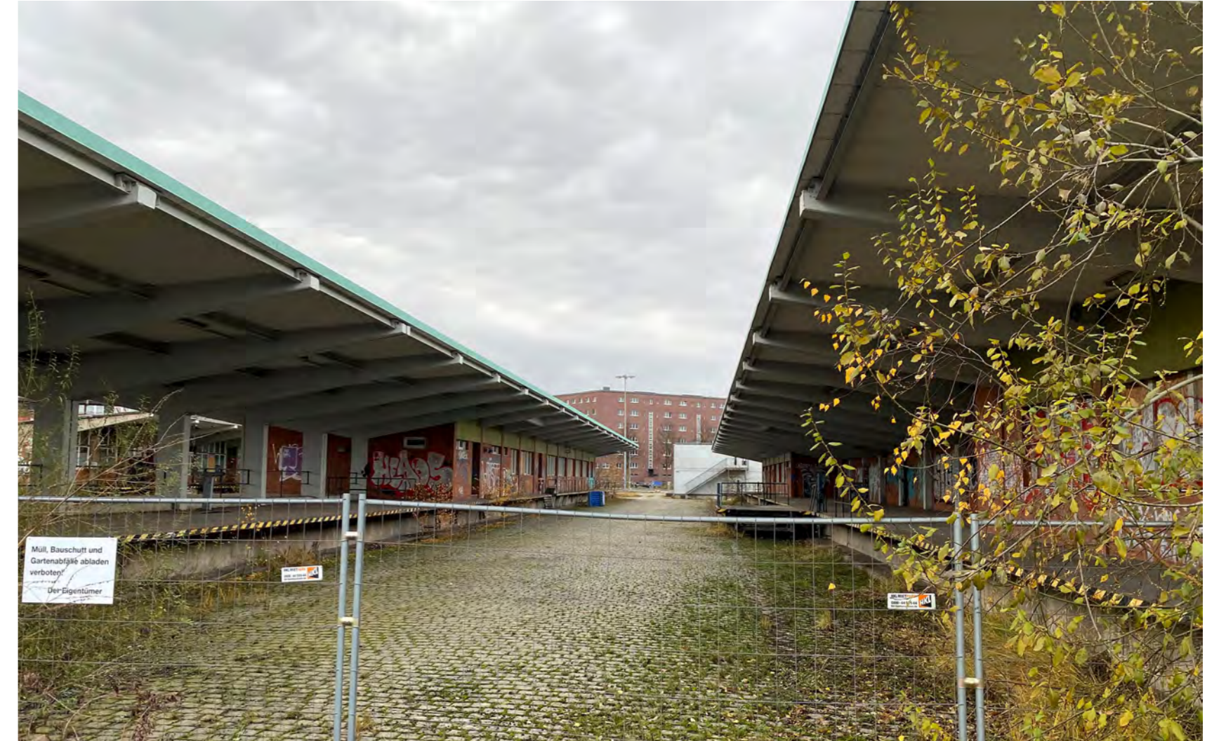
Bestandssituation ehemalige Zollanlage

Der unten abgebildete Entwurf setzt auf Stroh als Dämmmaterial. Auch Folien im Wand- und Dachbereich sorgen für Wärme durch solare Gewinne.